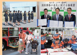
■ 表紙 本号掲載記事より